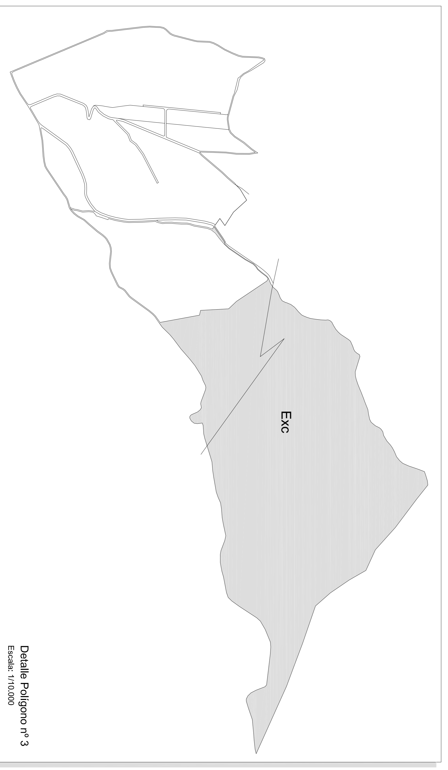
Detalle Polígono n° 3 Escala: 1/10.000