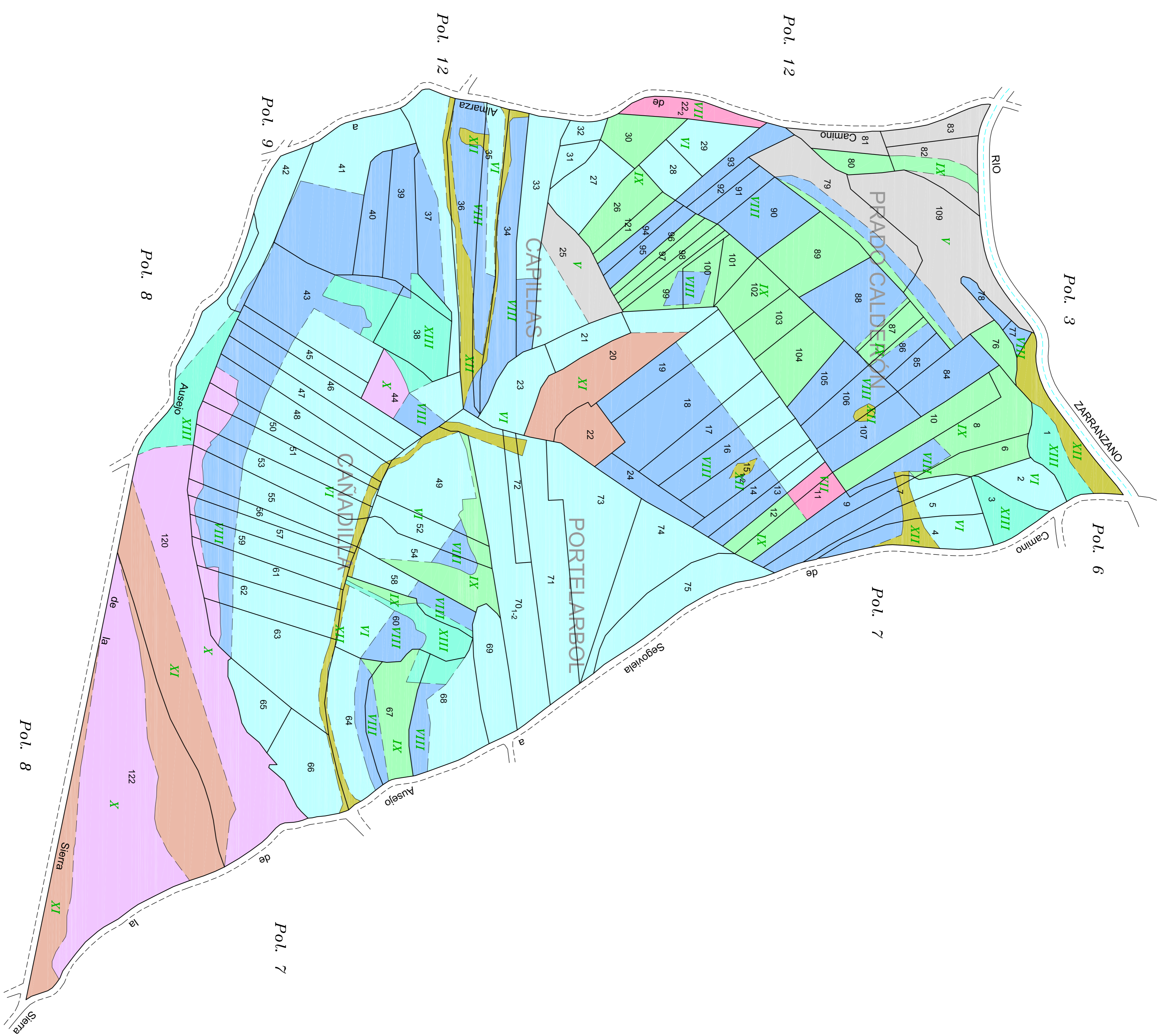
GAMA DE COLORES PARA LAS DIFERENTES CLASES DE SUELO