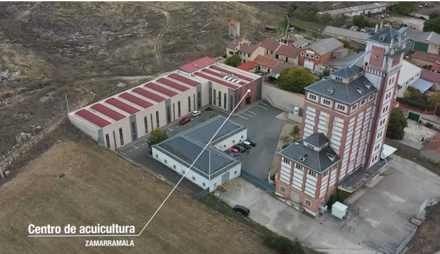
Centro de acuicultura ZAMARRAMALA